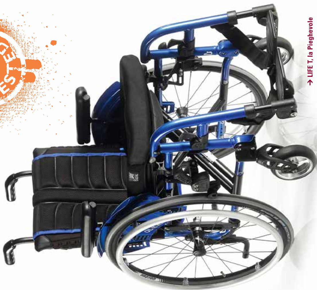
→ LIFE T, la Pieghevole