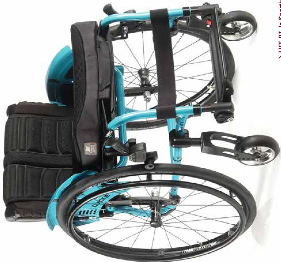
→ LIFE RT, la Sportiva